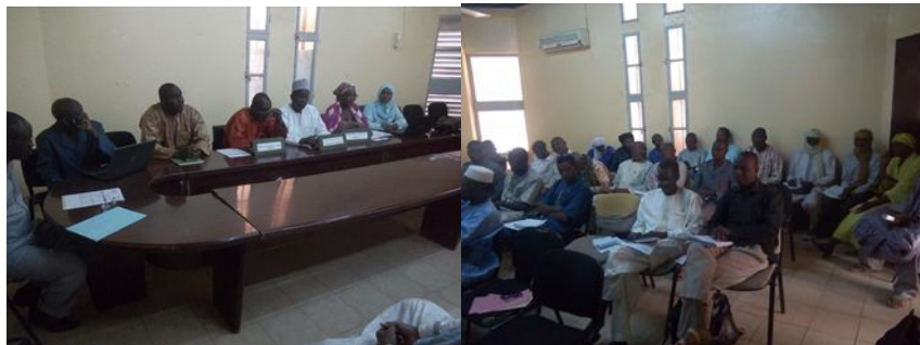
Antenne d'Agadez : Mission d'information et de sensibilisation sur le processus d'expression de la demande à Agadez le 28 Octobre 2016

L'antenne d'Agadez a commencé ses missions d'information et de sensibilisation le 28 octobre 2016 dans la ville d'Agadez, regroupant trois (03) communes dont Agadez, Ingall et Aderbissanat, ces deux dernières étant en même temps des départements. Les participants au nombre de 42 comprenaient trois (03) responsables communaux sur 3 invités et de deux (2) représentants des producteurs sur 3 invités. Les communes représentaient 7% de l'ensemble des participants, et les OP 4%, ce qui constitue des taux de représentativité assez faible pour les bénéficiaires potentiels du Programme (OP et Communes).