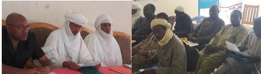
Antenne de Tahoua : Mission d'information et de sensibilisation sur le processus d'expression de la demande à Abalak le 31 Octobre 2016

L'antenne d'Agadez a commencé ses missions d'information et de sensibilisation le 28 octobre 2016 dans la ville d'Agadez, regroupant trois (03) communes dont Agadez, Ingall et Aderbissanat, ces deux dernières étant en même temps des départements. Les participants au nombre de 42 comprenaient trois (03) responsables communaux sur 3 invités et de deux (2) représentants des producteurs sur 3 invités. Les communes représentaient 7% de l'ensemble des participants, et les OP 4%, ce qui constitue des taux de représentativité assez faible pour les bénéficiaires potentiels du Programme (OP et Communes).