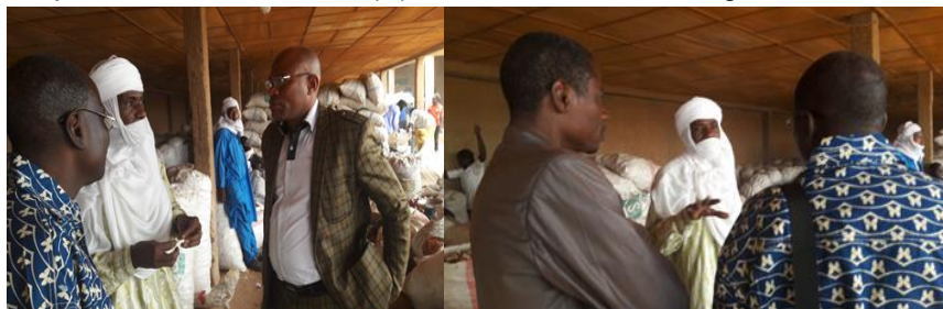
Visite de site et échanges avec le président de l'union des Coopératives Maraîchères de Tabelot (UCMT) à Agadez