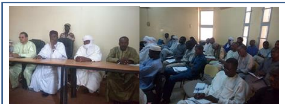
Antenne d'Agadez : Mission d'information et de sensibilisation sur le processus d'expression de la demande