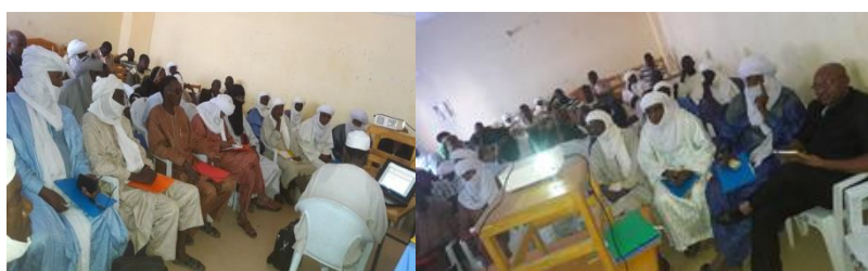
Antenne de Tahoua : Mission d'information et de sensibilisation sur le processus d'expression de la demande à Tchintabaraden le 30 Octobre 2016

Au cours de cette période, l'antenne de Tahoua a visité cinq (5) départements (Tahoua, Tchintabaraden, Tillia et Tassalat (présents à Tchintabaraden), et Madaoua) représentant seize (16) communes et deux (02) arrondissements communaux que sont les arrondissements communaux 1 et 2 de Tahoua. Au total 92 participants, soit 85% de participation, ont répondu à ces trois séances d'animation avec cependant une très faible participation des OP et de leur faïtière (moins de 1%).