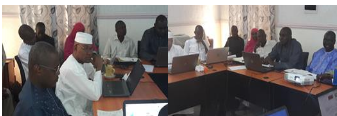
Atelier interne de finalisation des outils d'expression de la demande

En effet l'expérience capitalisée auprès des projets et programmes partenaires a permis au PISA d'opter pour l'ouverture des comptes « contrepartie des bénéficiaires » par le Programme ( et non par le bénéficiaire), la nécessité d'une contribution financière obligatoire ( et non physique comme dans d'autres structures projets) permettant d'avoir une plus grande chance dans la pérennisation des investissements par l'appropriation de ceux-ci par le bénéficiaire et le plafonnement des couts des différents types d'aménagement.